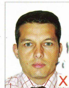
Traces / Pliures